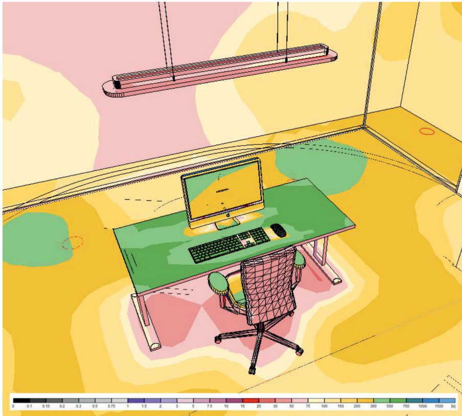
luxwaarden op bureaublad