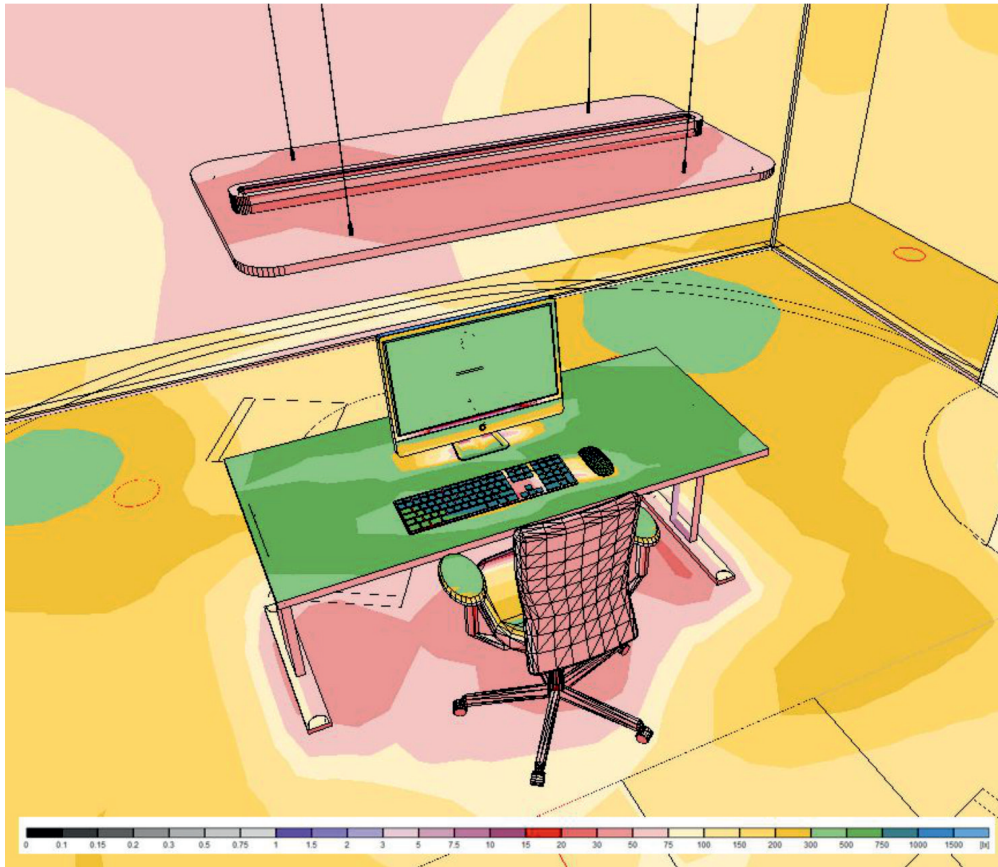
luxwaarden op bureaublad