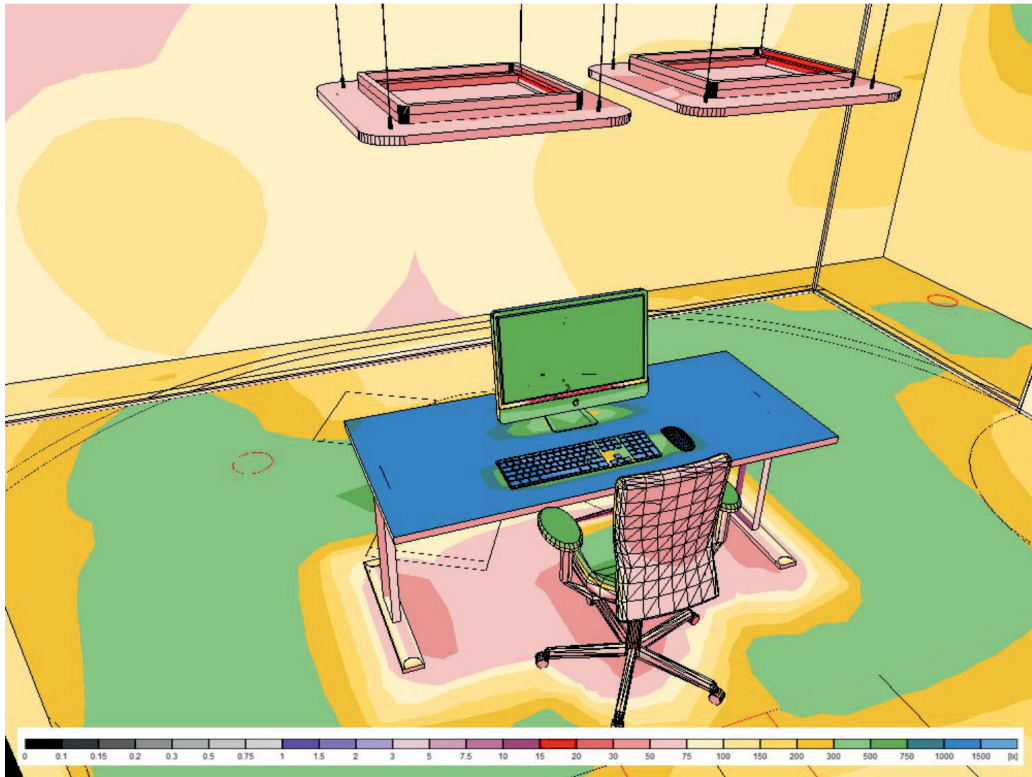
luxwaarden op bureaublad